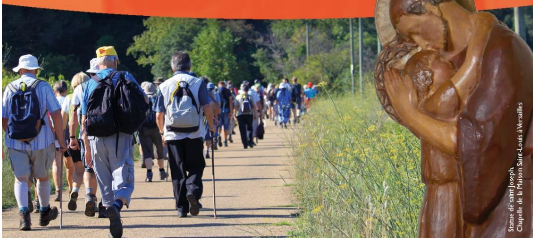
Statue de saint Joseph. Chapelle de la Maison Saint-Louis à Versailles

De Rambouillet vers le sanctuaire de la Divine Miséricorde de Gallardon (Eure-et-Loir).